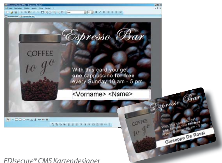
EDiSecure® CMS Kartendesigner