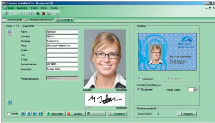
EDIsecure® CMS Standard Plus