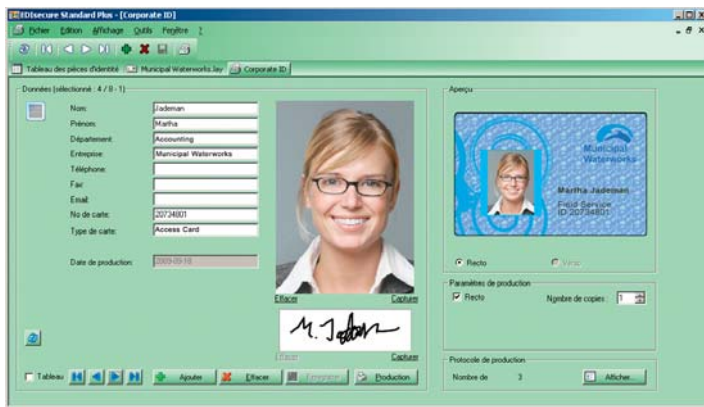
EDIsecure® CMS Standard Plus