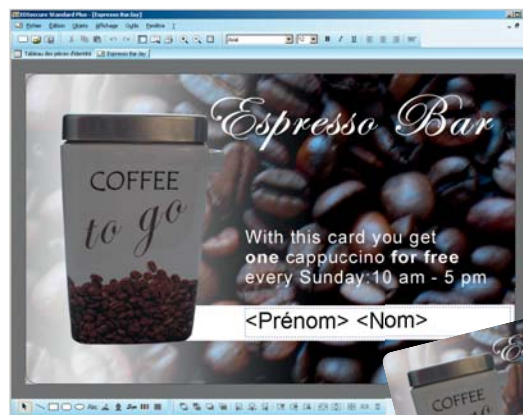
Le module graphique de création de cartes de EDISecure® CMS